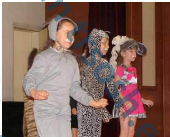
«Кошки и Мышки - блестящий дебют. Вместе танцуют и вместе поют...»