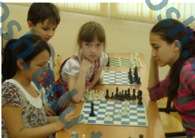
Мы с удовольствием принимали участие в шахматных баталиях.