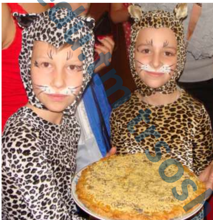
Ура!!! Мы выиграли и стали «Звёздным отрядом». Мы заработали больше всех «звёздочек» - 75! А это наш приз - сладкий пирог. Всем достанется. Спасибо организаторам лагеря за чудесный отдых.