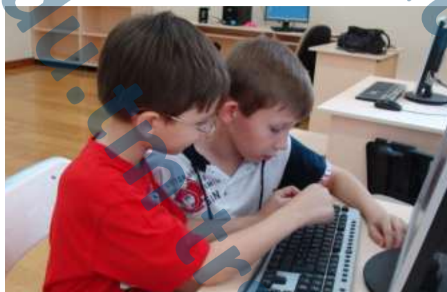
Нам понравились занятия на компьютере. Мы научились составлять пазлы.