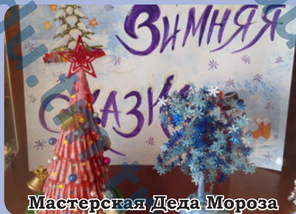
Мастерская Деда Мороза