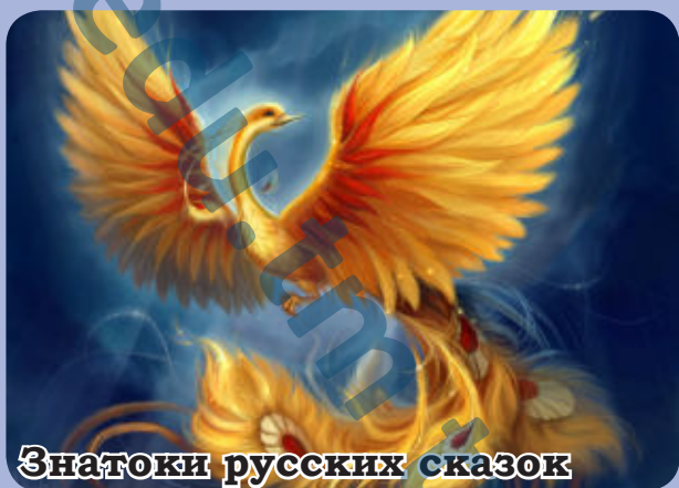
Знатоки русских сказок