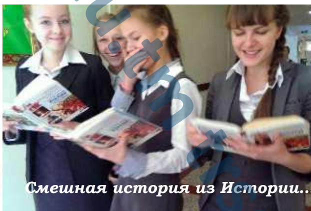
Смешная история из Истории...