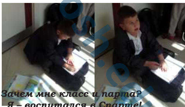
Зачем мне класс и парта? Я - воспитался в Спарте!