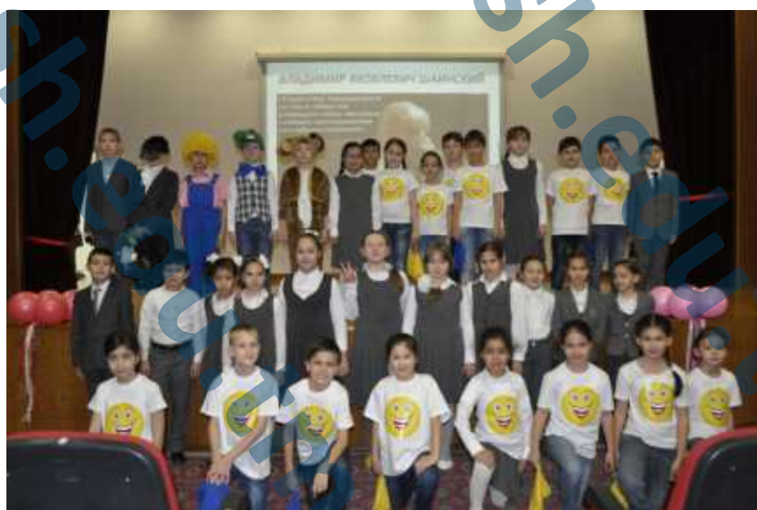
пресс-центр 3 «В» класса