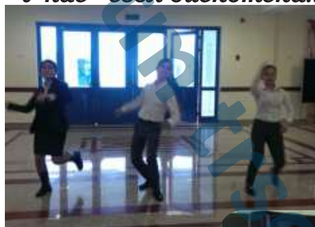
У нас - своя дискотека!...