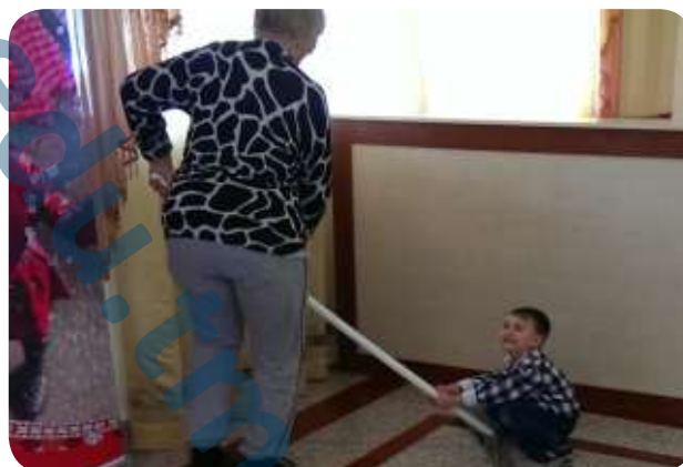
Не летает, но катает!