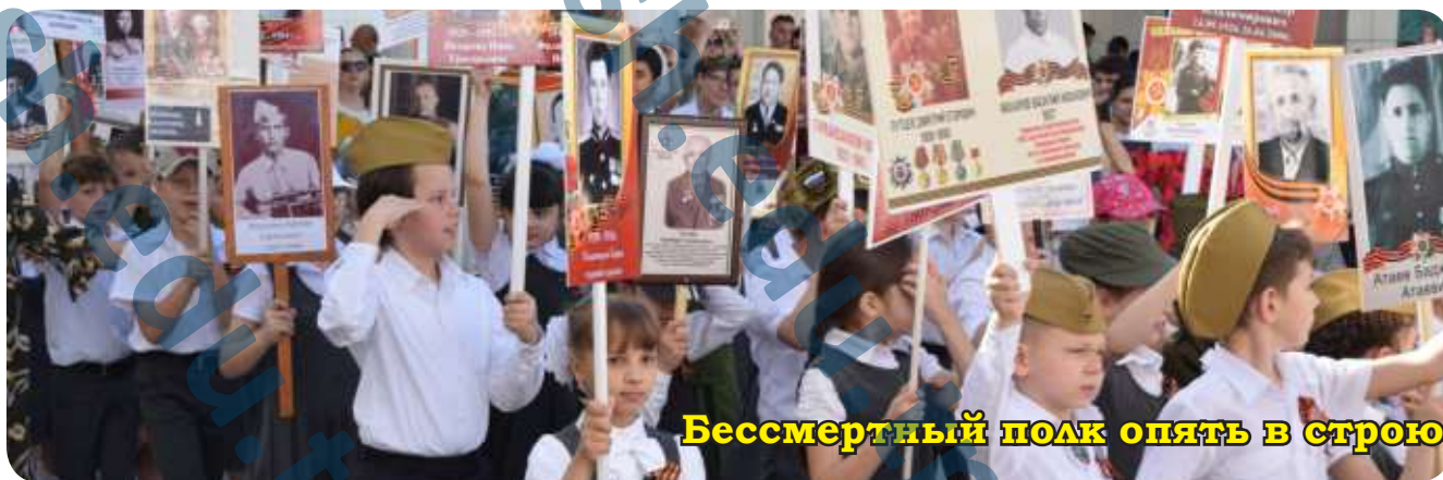
Бессмертный полк опять в строю

9 мая - день нашей гордости, нашего величия, мужества и отваги. День нашей памяти. Мы в вечном долгу перед теми, кто подарил нам Мир, Весну, Жизнь. Пока мы будем помнить об этой войне - мы будем жить, будет жить наша страна. Этот праздник всегда будет самым светлым и радостным праздником на земле.