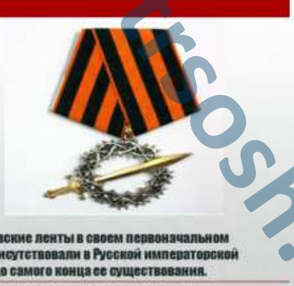
Георгиевские ленты в своем первоначальном виде присутствовали в Русской императорской армии до самого конца ее существования.

И вот весной 2005 года на улицах российских городов впервые появились «Георгиевская ленточка». Эта акция родилась стихийно, выросла она из Интернет-проекта «Наша Победа», главной целью которого была публикация историй и фотографий времен Великой Отечественной войны. Ленточка стала своеобразным атрибутом торжественных мероприятий, традиционных встреч с ветеранами, праздничных гуляний во многих городах Российской Федерации.